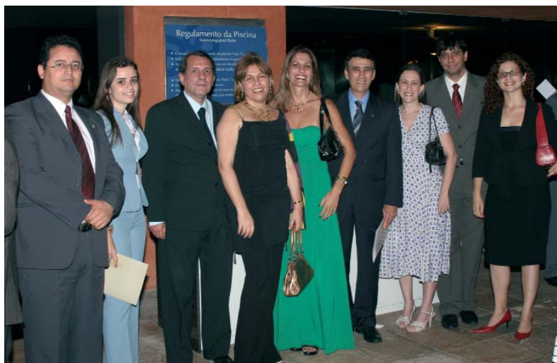
Magistrados do Trabalho da 21ª Região participaram do Encontro em Recife